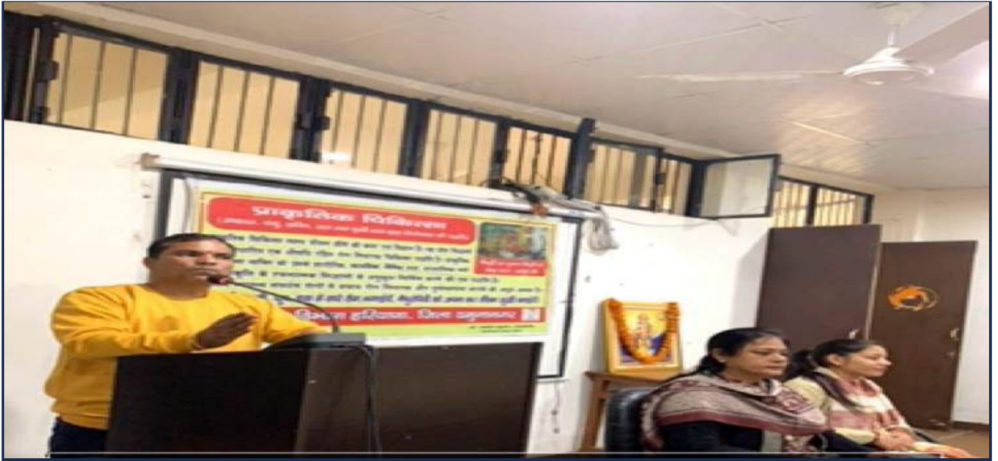
Department of Physical Education and Sports and NSS Unit organised a Aerobics Training Workshop for students on the occasion of National Youth Day i.e. 12 th January,2024