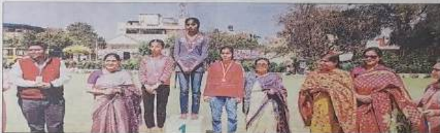
खेल प्रतियोगिता की विजेता प्रतिभागी को सम्मानित करते शिक्षक व कर्मचारी। संस्थान

यमुनानगर। गुरु नानक गुरु कालेज व साई सौभाग्य संस्था ने संयुक्त रूप से अंतरराष्ट्रीय महिला दिवस के उपलक्ष्य में कार्यक्रम का आयोजन किया गया। इसमें कालेज के शारीरिक शिक्षा विभाग की ओर से साई सौभाग्य संस्था के विद्यार्थियों के लिए खेल प्रतियोगिताएं करवाई गईं।